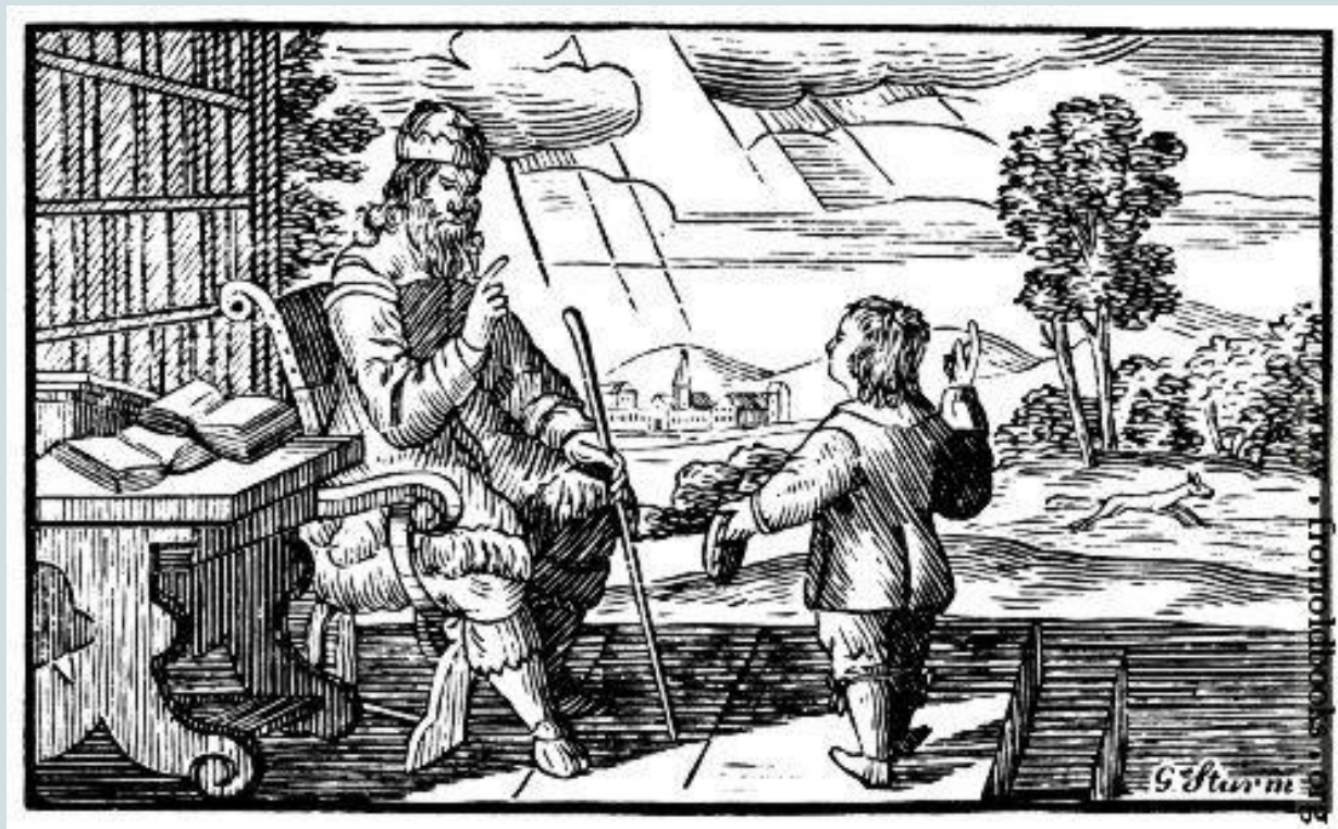
“INVITATION - THE MASTER AND THE BOY” BY JAN AMOS KOMENSKY (ORBIS PICTUS, 1658)