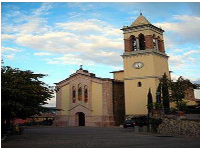
CHIESA DI S. BARTOLOMEO

La chiesa di Solomeo, dedicata a San Bartolomeo, fu edificata tra la fine del XII secolo e la metà di quello successivo.