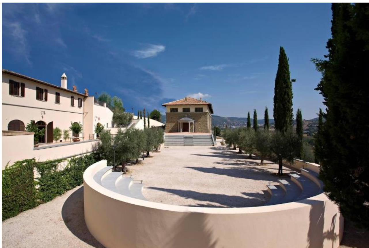
TEATRO E ANFITEATRO

La posizione del sito è straordinaria: appena sotto le ultime case del Borgo, si adatta alle forme della costa collinare che si affaccia sull'incomparabile bellezza del paesaggio. Più in basso, oltre questo edificio, ci si ricollega al paesaggio di valle mediante le terrazze aeree di un giardino profumato dalle rose e dal rosmarino, detto Giardini dei Filosofi.