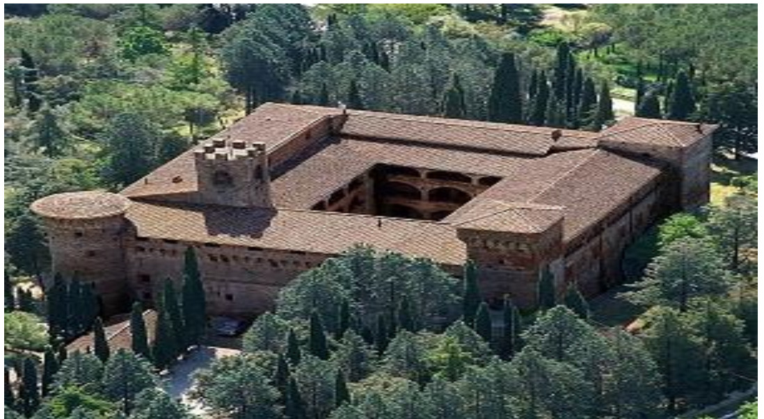
CASTELLO DI SOLOMEO

Dal 1985 Brunello Cucinelli ha fatto del borgo la sede della sua impresa umanistica.